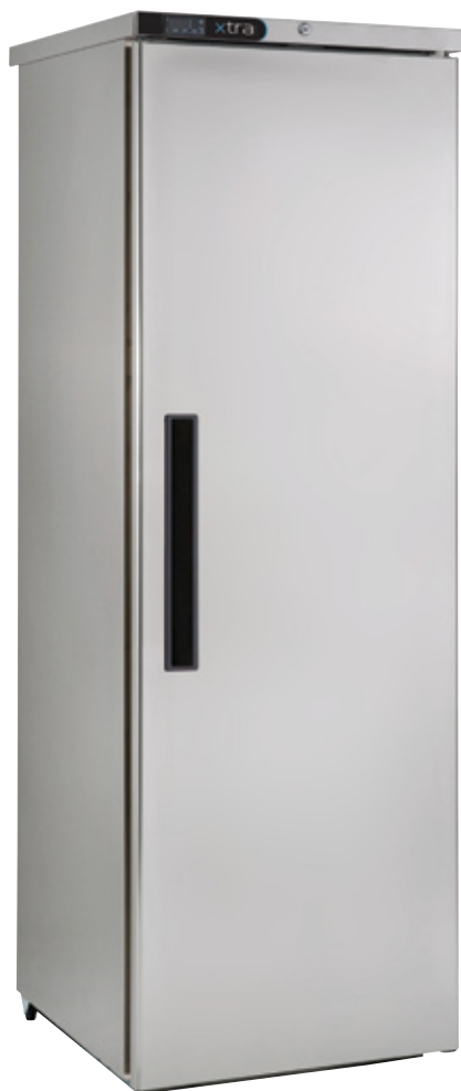
XR415H kast met een inhoud van 400 liter