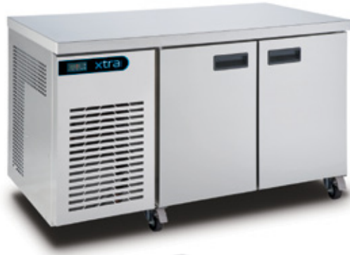
XR2H gekoelde werkbank