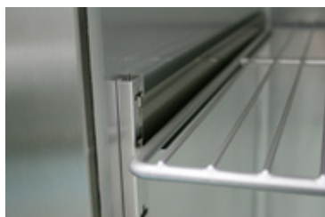
Gastronorm roosters worden met de kasten meegeleverd; 3 stuks bij de 1 deurs kasten en 6 bij de 2 deurs kasten