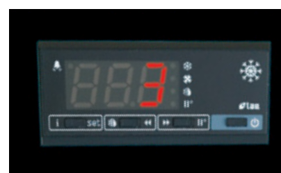
De microprocessor controller zorgt voor een nauwkeurige temperatuurregeling