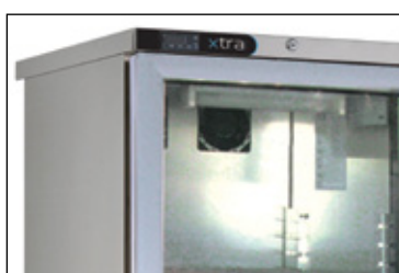
Glasdeur is ook mogelijk (maximale omgevingstemperatuur 25° C)