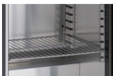
4 x Nylon gecoate draadroosters (480 x 420mm)