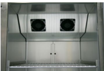
Het koelsysteem houdt de temperatuur in de kast op peil in warme keukens