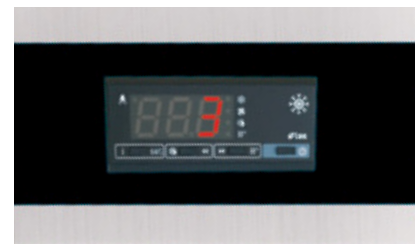
De microprocessor-controller zorgt voor een nauwkeurige temperatuurregeling